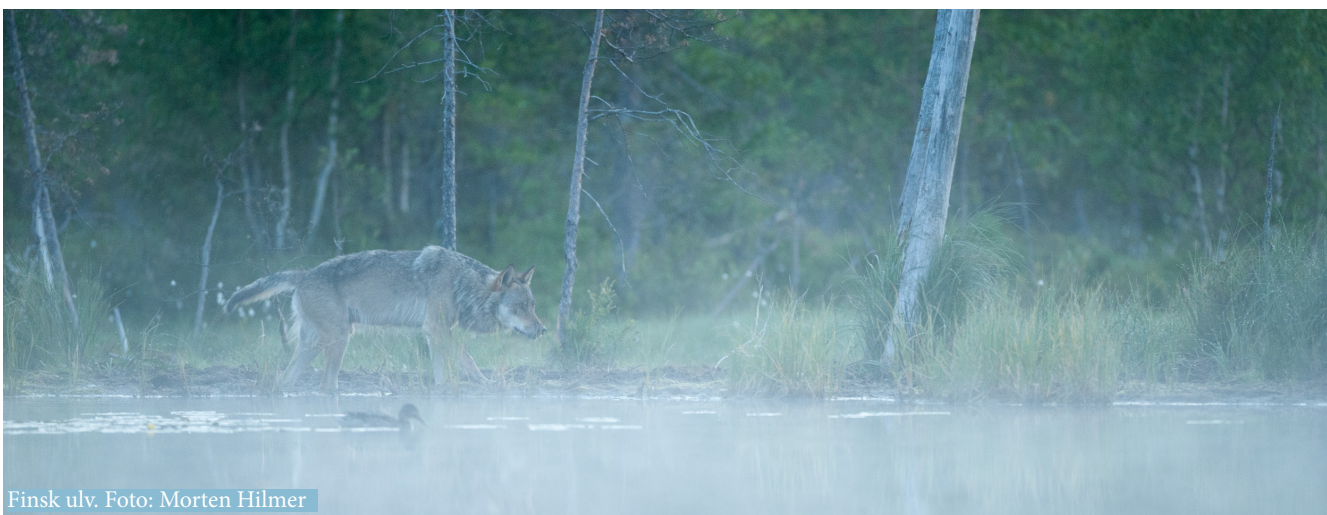
Finsk ulv.

Diet composition of 42 wolf scats collected in the period 2013-14 based on occurrence % with 95% confidence limits.