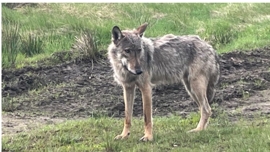
Foto taget d. 22. maj 2026 kl. 09:02 mellem Grærup Strand og Oksbøl af borger.