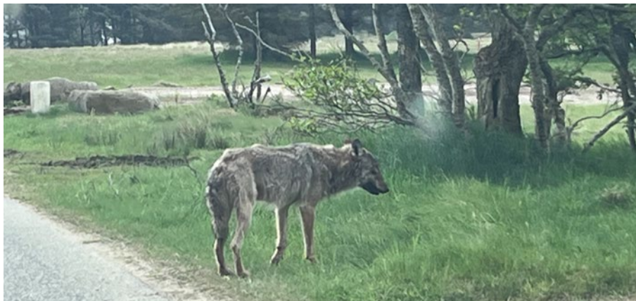
Foto taget d. 22. maj 2026 kl. 09:02 mellem Grærup Strand og Oksbøl af borger.