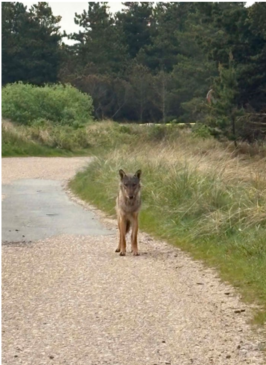
Foto taget d. 23. maj 2026 kl. 11 ved et sommerhusområde ved Grærup Strand af borger.

Vurdering: Det video- og fotodokumenterede materiale viser, at ulven forholder sig observerende og afventende i retning af observatøren, som sidder i en bil. Øre og hale holdes flere gange lavt, hvilket viser tegn på usikkerhed. Afstand vurderes ud fra billedmateriale til ikke under 15 meter. Ud fra den medfølgende beretning befandt to cyklister sig ved siden af bilen, dvs. på 15-20 m afstand af ulven (rapporteret: 10 m). Normalt vil en ulv ikke lade personer i det fri komme så tæt på. Forløbet dokumenteret i videoen kan dog tolkes i den retning, at bilen til at starte med har været i synsfeltet, så ulven først har opdaget cyklisterne efter at have krydset over vejen, hvor den stoppede op (billede 2 fra video), vendte om og trak sig væk med et kropssprog, som udviser usikkerhed med situationen (sænkede ører og halen mellem benene: billede 3 og 4 fra video).