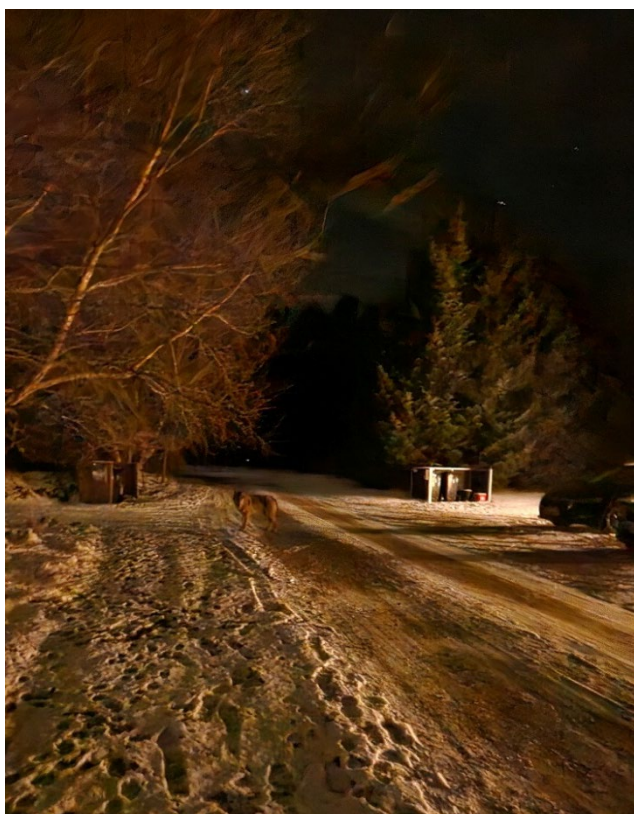
Privatfotos fra episode (A).

I den ene episode (A) er to mænd ude at lufte hund, hvor de møder tre ulve på en grusvej i et sommerhusområde i Ho nord for Ho Klitplantage ca. kl. 20:30. Her er de væsentligste detaljer gengivet på baggrund af en mail, den ene person efterfølgende har sendt til den nationale ulveovervågning: "Min kammerat og jeg gik en tur med min hanhund (gammel dansk hønsehund) i snor, vi har gået frem og tilbage af vejen mod *(stednavn fjernet, red.). Jeg ser noget bevæge sig langs vores rute ud af øjenkrogen, men kan ikke helt identificere det. Vi går videre og snakker i alment leje i ca. 400 m. Da vi er 15 m fra det sommerhus vi hører til, vender jeg mig halvt om og ser tre ulve, hvor den nærmeste er 7 meter væk. Jeg får hunden hevet til mig og min kammerat og jeg konstaterer, at det ikke er en hund, der følger efter os. Ulvene viser ingen tegn på frygt. Jeg begynder straks at råbe højt og gå truende frem mod dem, min makker er ca. halvanden meter bag mig. Vi flytter os ca. 15 meter hen mod ulvene, hvor ulvene trækker sig lidt, men løber ikke væk. Først da vi går hurtigere frem og råber meget højt flere gange, løber de to af dem væk. Men forbløffende nok, så bliver den ulv, der har været nærmest hele tiden og den, der synes at være størst. Den flytter sig højst 10 meter fra os og begynder flere gange at gå frem mod os. Jeg råber højt ad den flere gange, men den viser ingen tegn på frygt og holder hovedet oppe. Vi ender med at gå baglæns ind i sommerhuset".