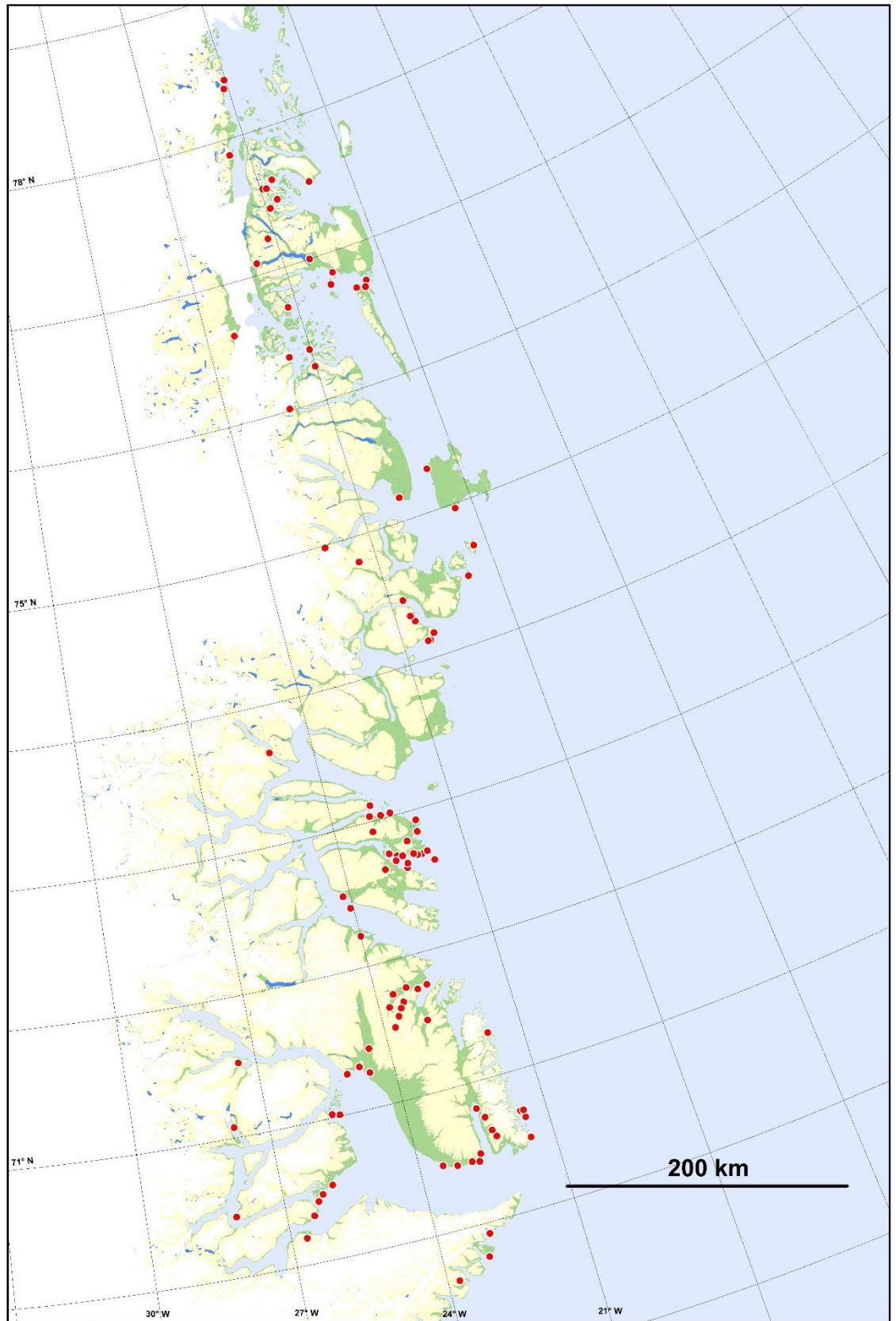
Assiliartaq2: Nerlernarnat manniorfiisa sumiinneri (aappalaartumik toornillit).