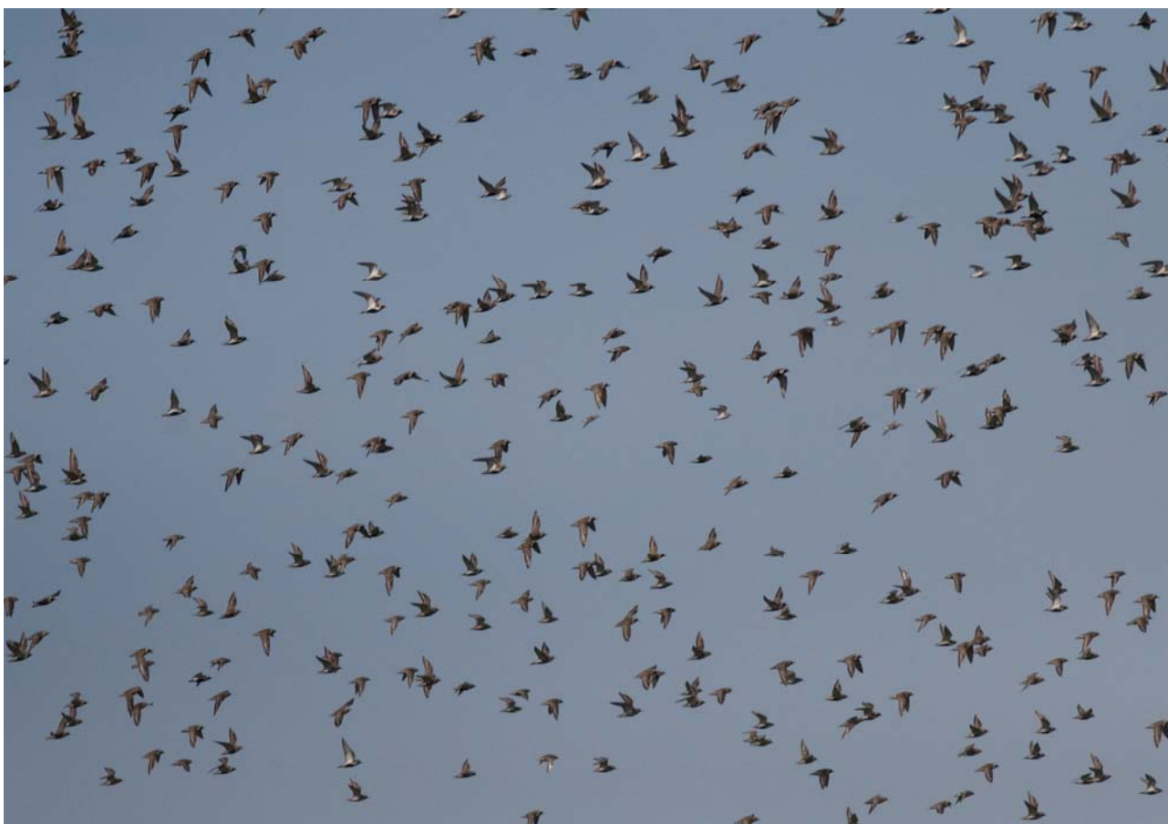
Hjejle har været talrig i de senere år på Tipperne. De seneste år har antallet være over 10,000 rastende fugle.

2014 blev et dårligt år for lille kobbersneppe. I foråret blev det største antal 564 fugle, hvilket er langt fra tidligere tiders antal på op til 4.000 fugle (i slutningen af 1990'erne). Efteråret blev også middelmådigt med 211 fugle i august som højeste antal. De seneste år er antallet af rovterne øget ved Ringkøbing Fjord. I 2014 blev der sat en ny rekord med i alt 15 fugle (11 adulte + 4 juvenile), hvilket sandsynligvis er det højeste antal nogen sinde i Jylland.