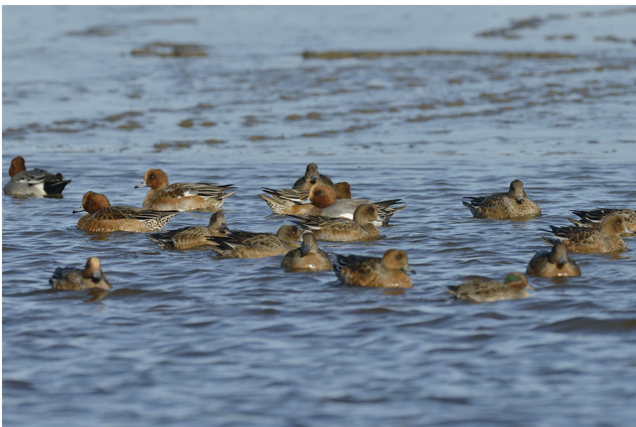
I 2015 blev der registreret over 26.000 pibeænder på Tipperne. Et antal som sidst blev set i 1974.