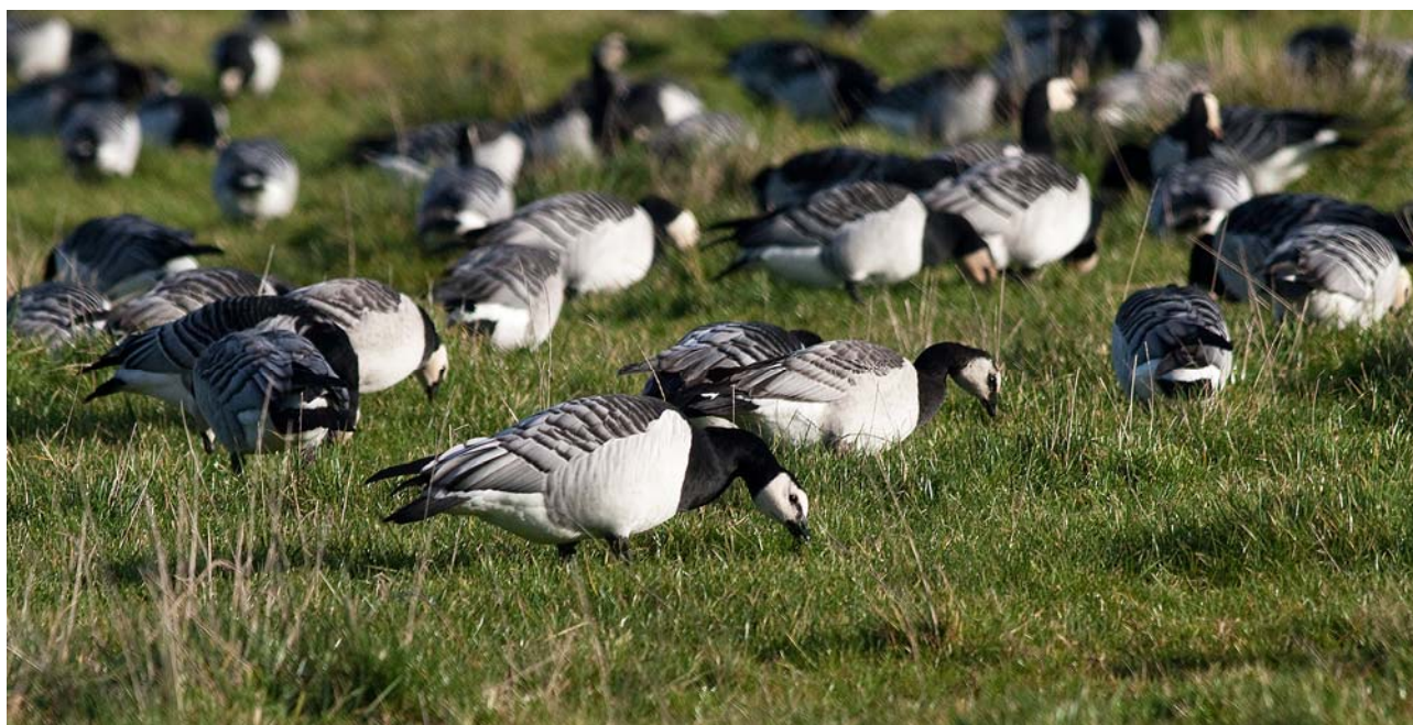
Antallet af bramgæs er steget meget i Vestjylland gennem de seneste år, og mellem 15.000-17.000 rastede på Tipperne i 2013.