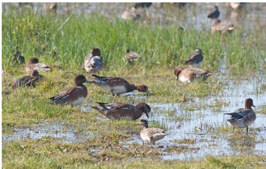
Pibeand forekom i store antal i 2013. På billedet ses kun hunner.

Blandt de øvrige svømmeænder lå antallene nær gennemsnittene fra de seneste år. I slutningen af december optrådte bjergand overraskende med 239 individer. Så høje antal er ikke set siden 1975, og arten har ikke været set årligt på reservatet. Det meste af efteråret blev der også registreret blichøne på tællingerne, og det største antal blev registreret den 23. oktober med 1.130 blichøns.